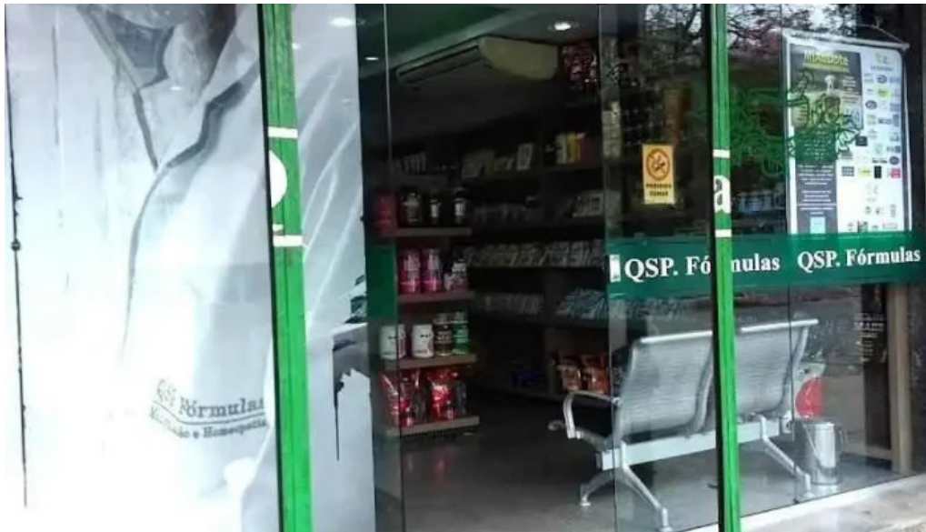
Qsp formulas cachoeiras de macacu