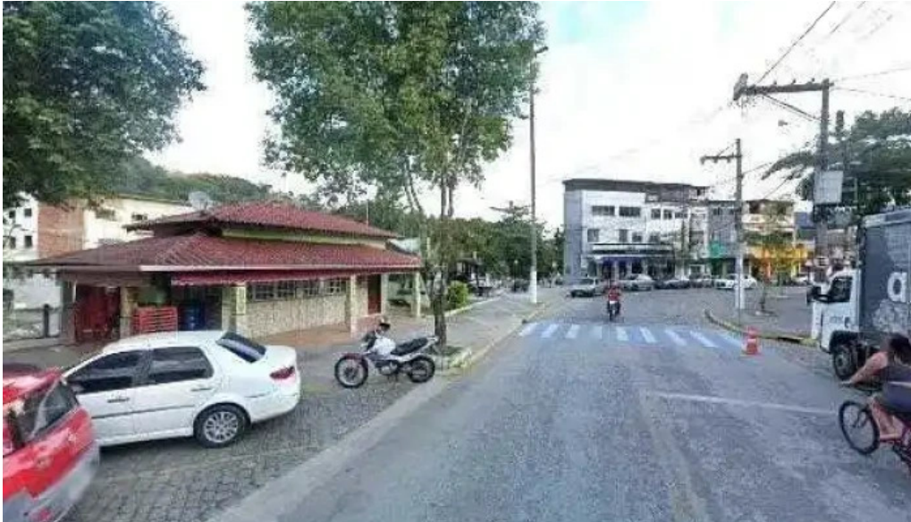
Qsp formulas street view e 360deg