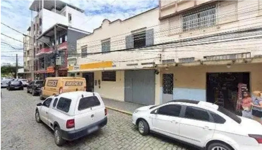
Farmacia central street view e 360deg