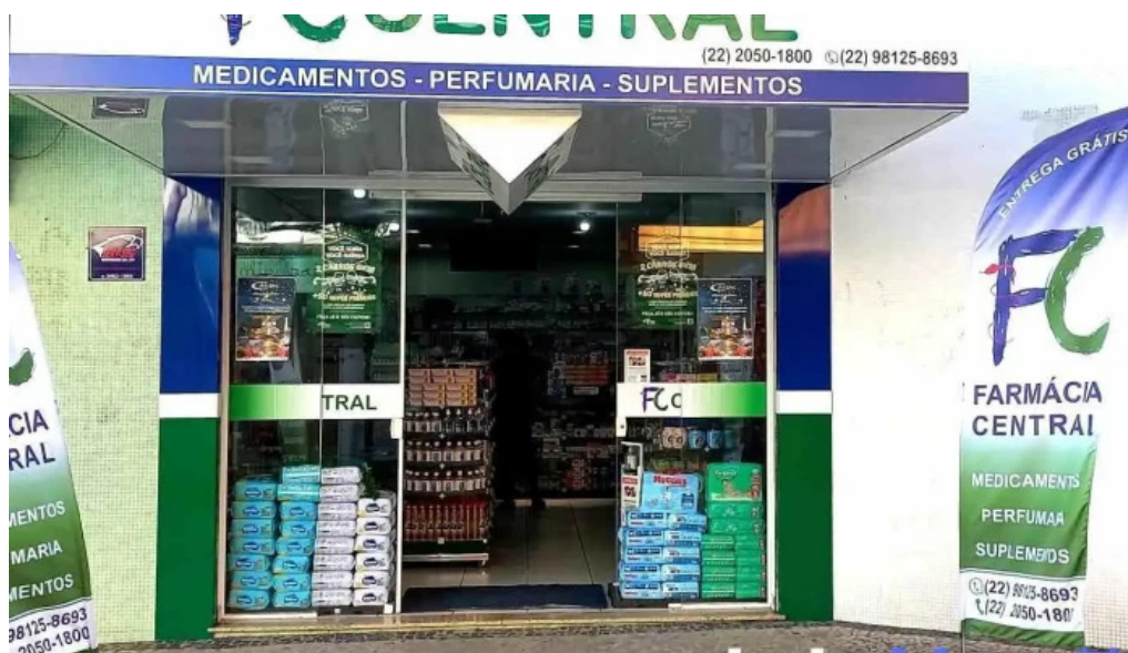
Farmacia central carmo