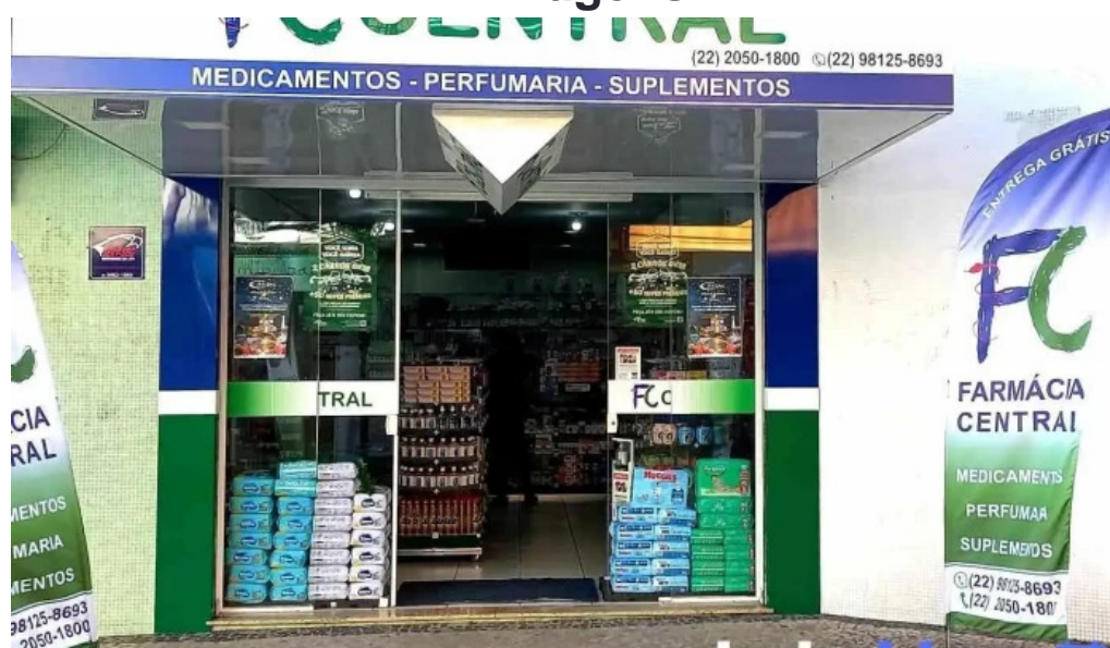
Farmacia central tudo