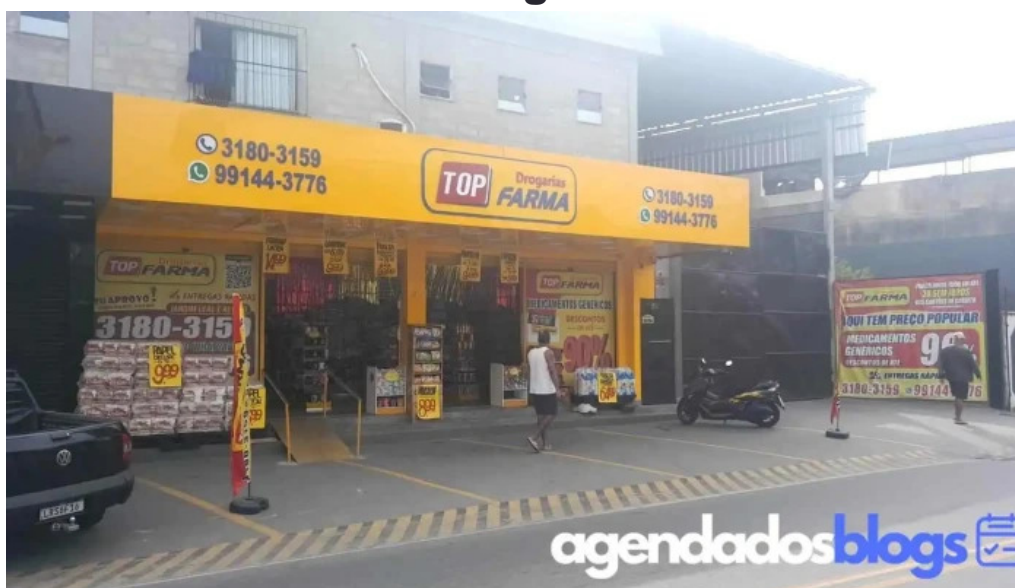
Drogaria top farma vila leopoldina duque de caxias