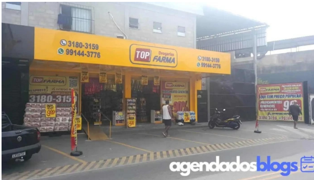
Drogaria top farma vila leopoldina tudo