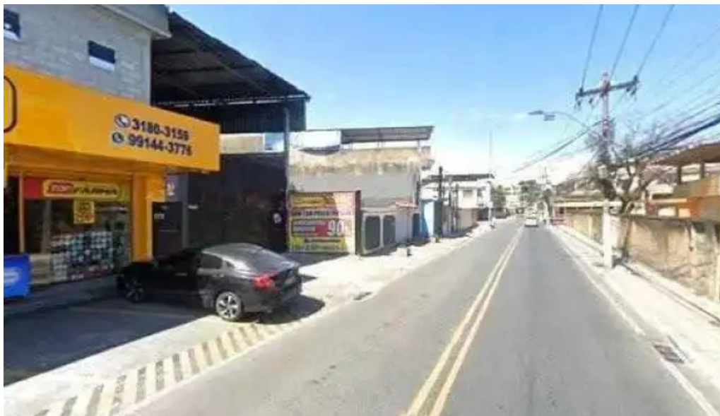
Drogaria top farma vila leopoldina street view e 360deg