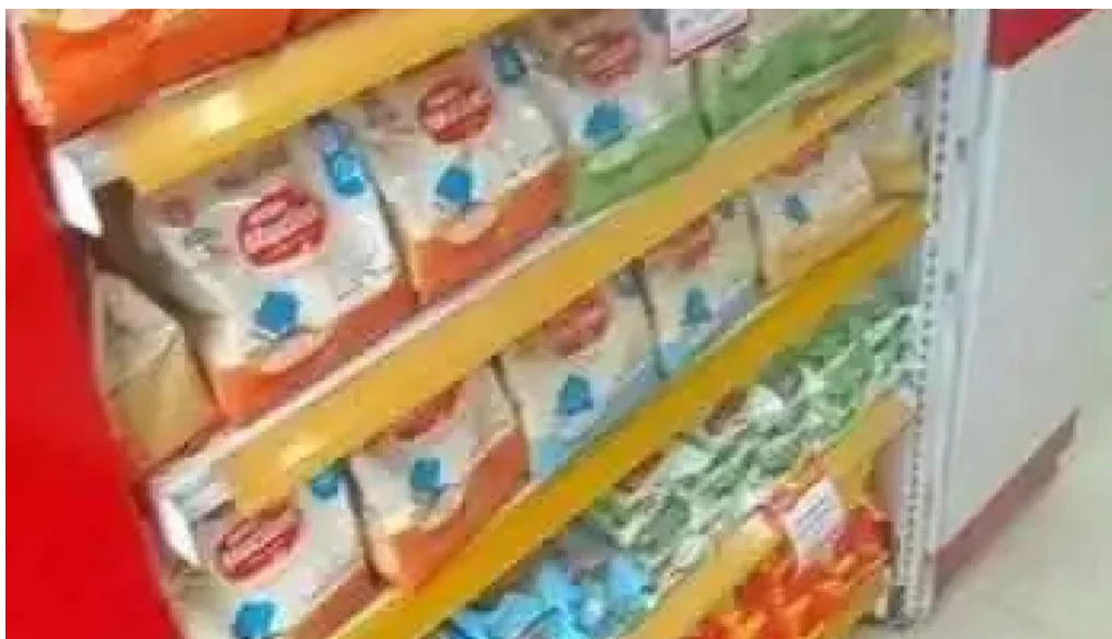
Drogarias tempresco nova campinas do proprietario