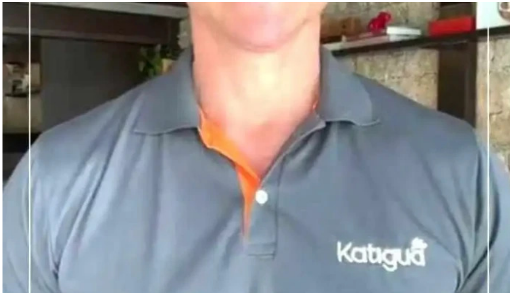
Drogarias tempreco nova campinas videos