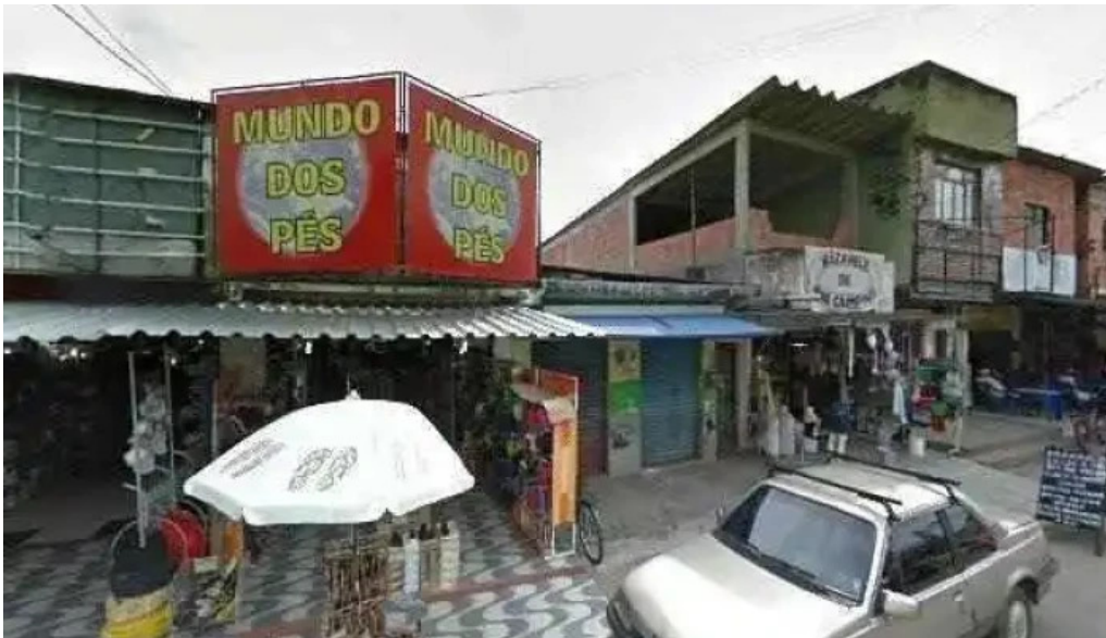
Drogarias tempresco nova campinas street view e 360deg