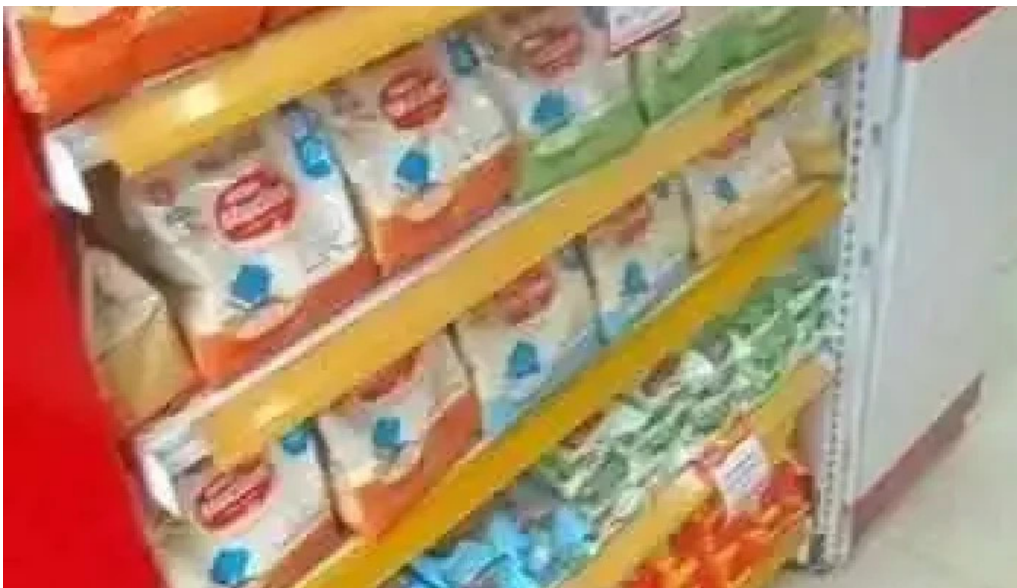
Drogarias tempreco nova campinas duque de caxias