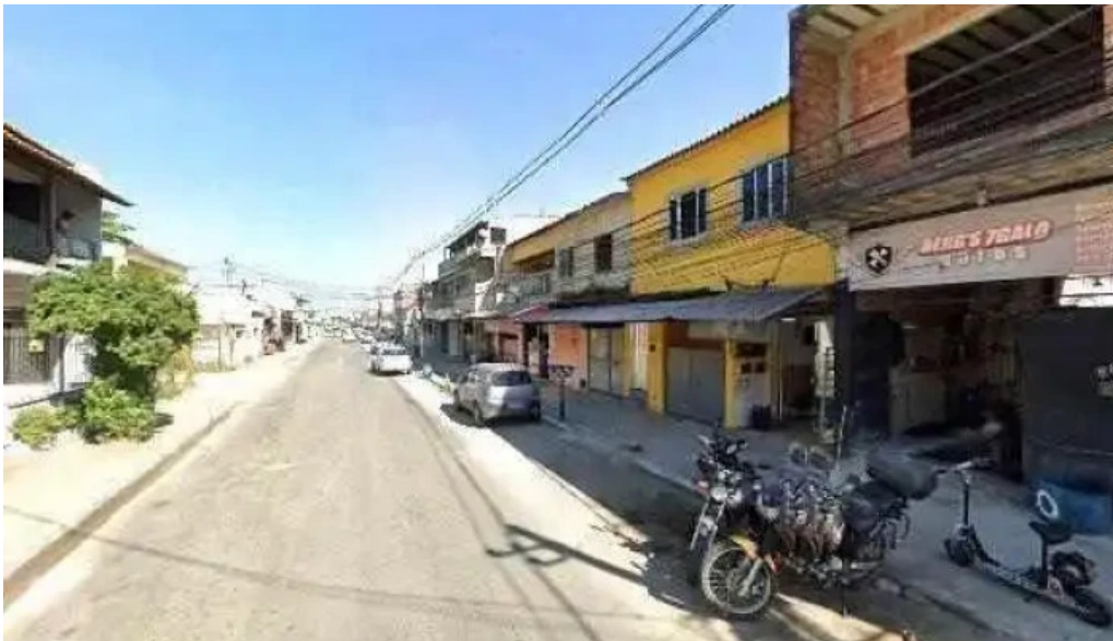
Drogaria avenida street view e 360deg