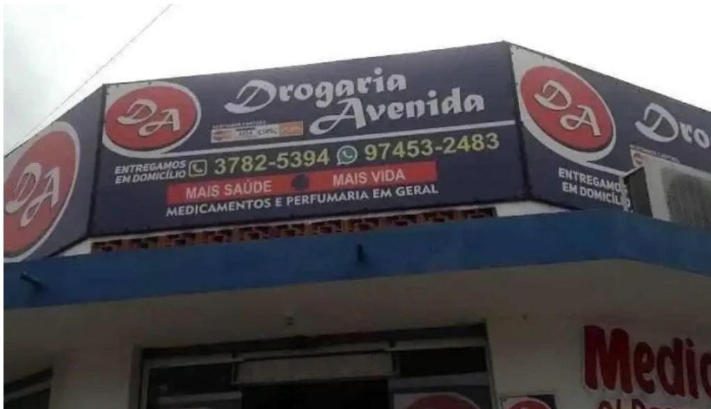
Drogaria avenida itaguai