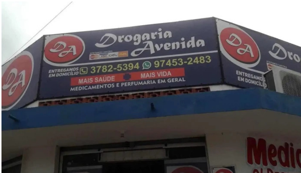
Drogaria avenida tudo