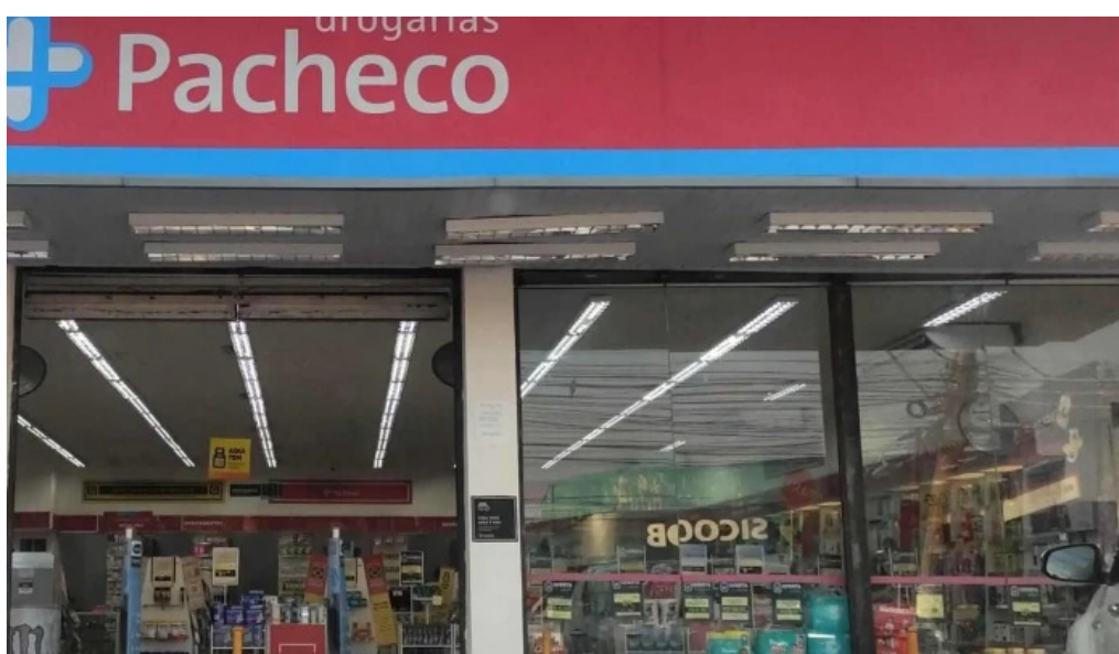
Drogarias pacheco farmacia