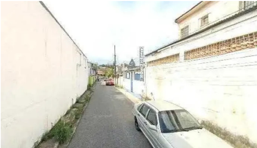
Drogarias pacheco street view e 360deg