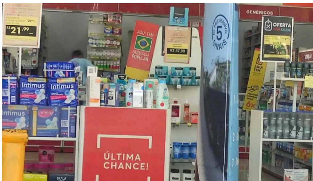
Drogarias pacheco itaguai