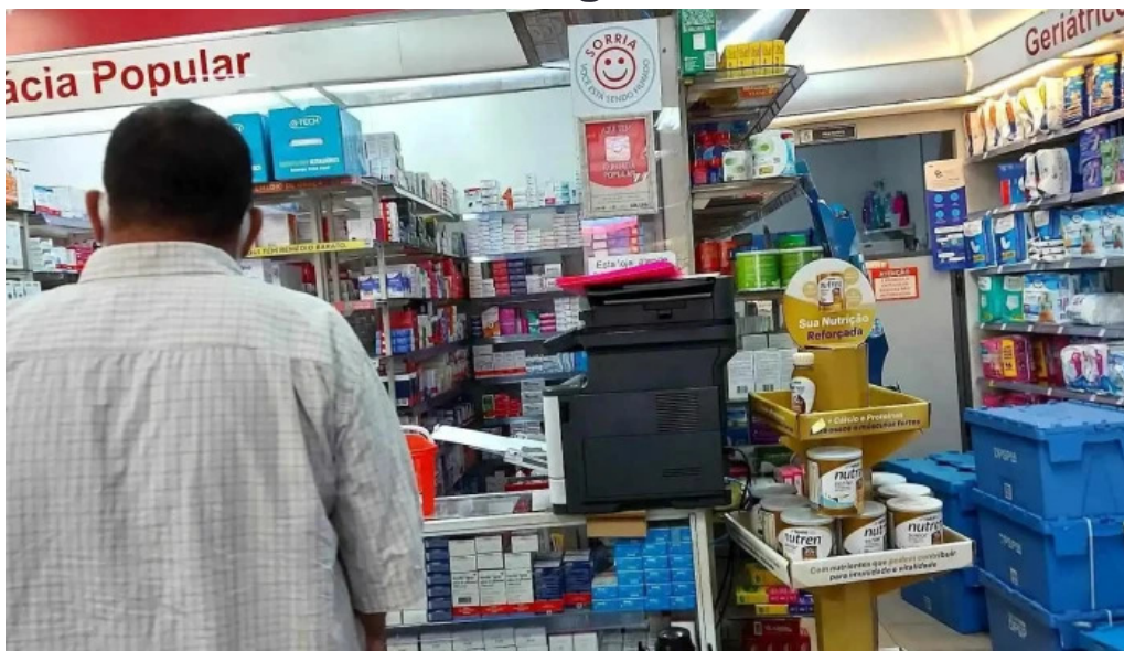
Drogarias pacheco tudo