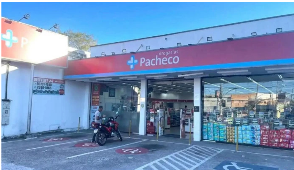
Drogarias pacheco itaguai