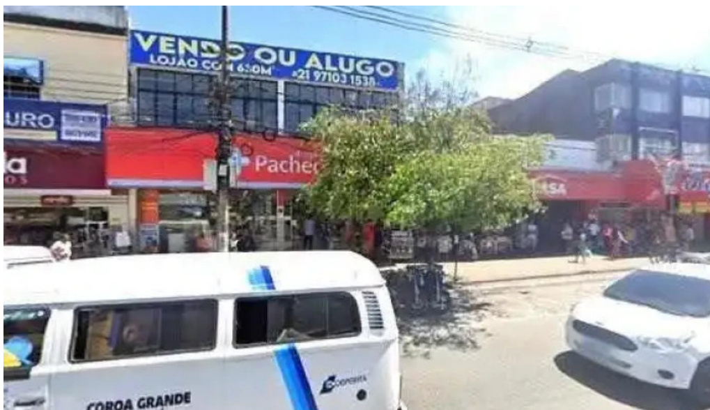
Drogarias pacheco street view e 360deg