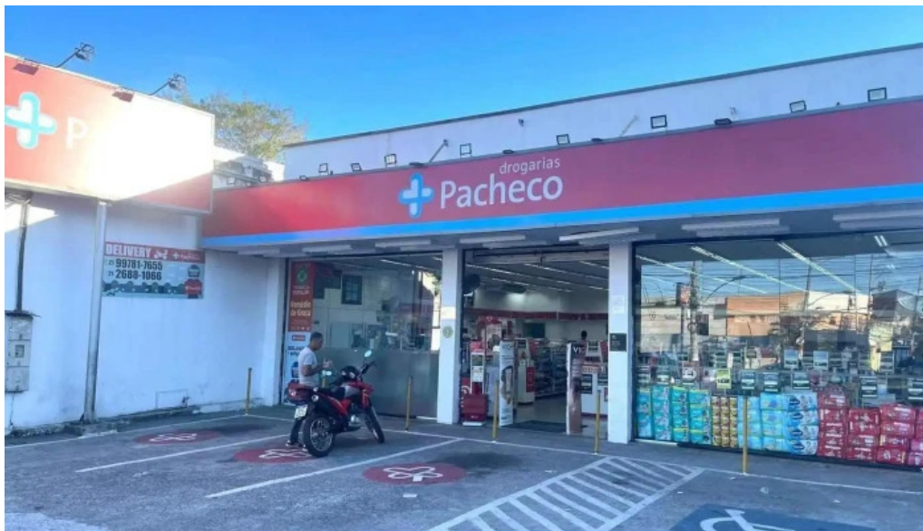
Drogarias pacheco do proprietario