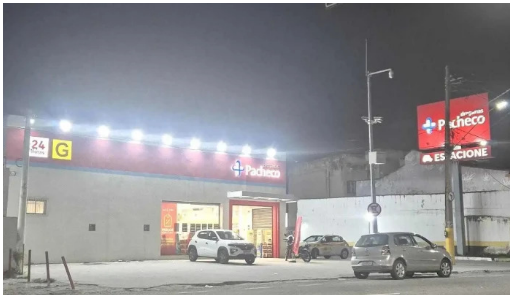
Drogarias pacheco tudo