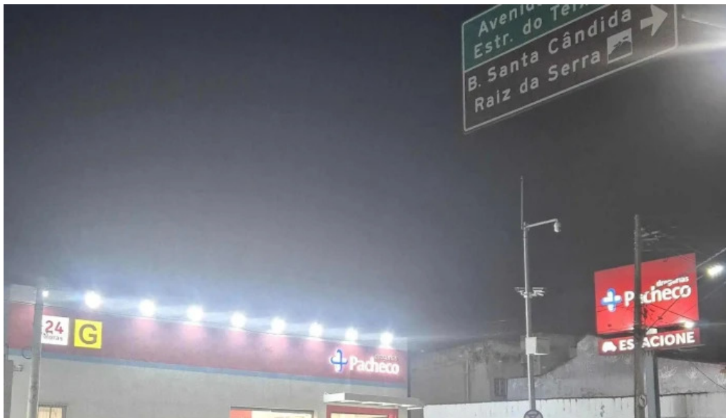
Drogarias pacheco farmacia