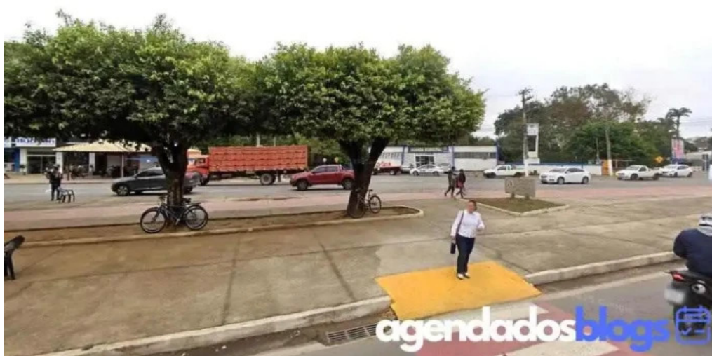
Sannis farmacia de manipulacao itaperuna