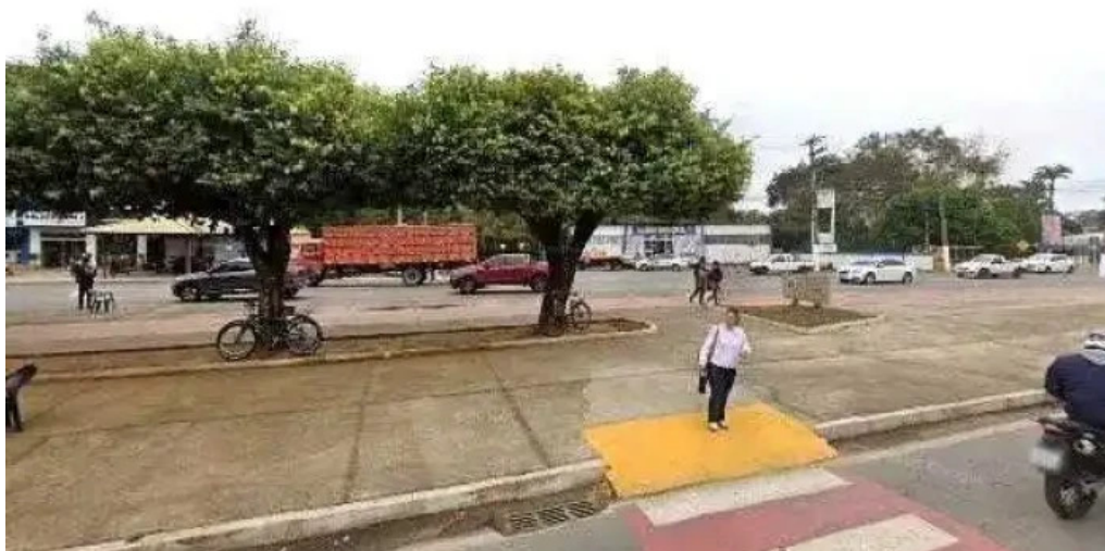
Sannis farmacia de manipulacao tudo