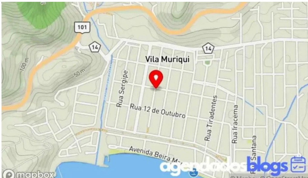
Drogaria da praca mapa