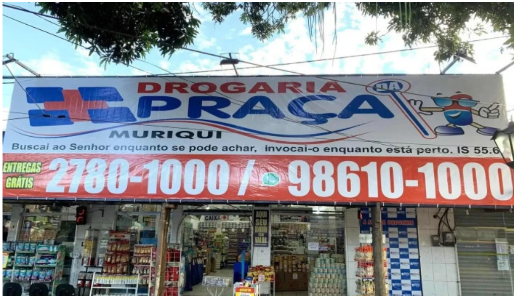
Drogaria da praca tudo