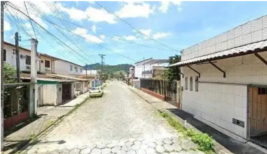
Drogaria da praca street view e 360deg