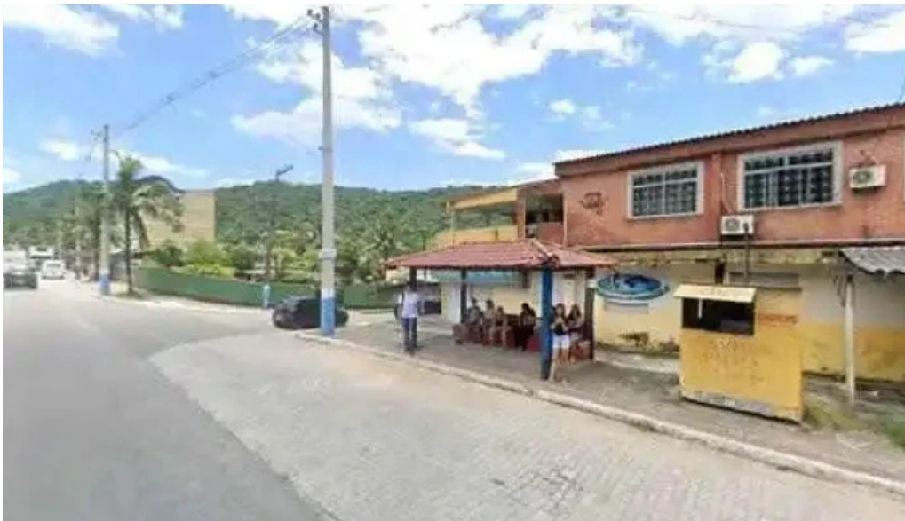
Drogaria pronto farma street view e 360deg