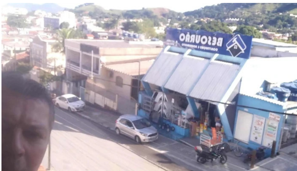
Drogaria pronto farma mangaratiba