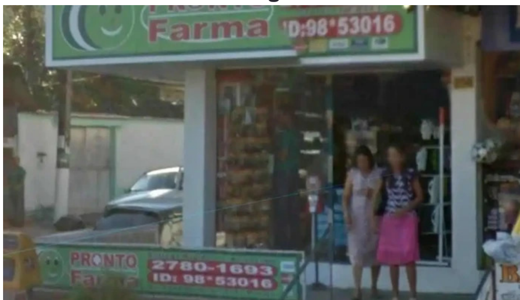
Drogaria pronto farma tudo