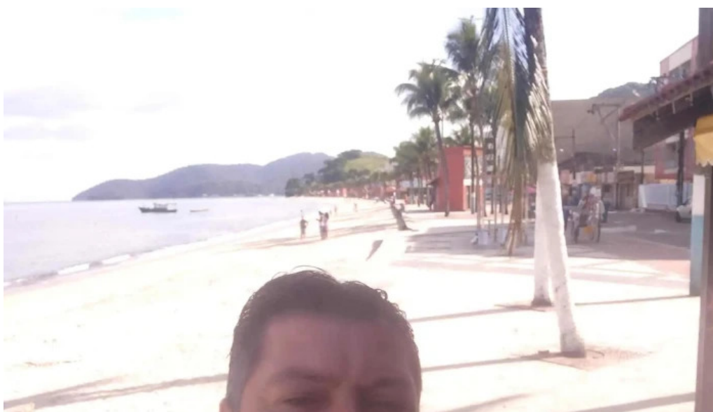
Drogaria pronto farma farmacia