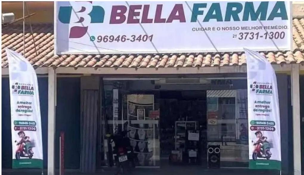
Drogaria bellafarma itapeba marica