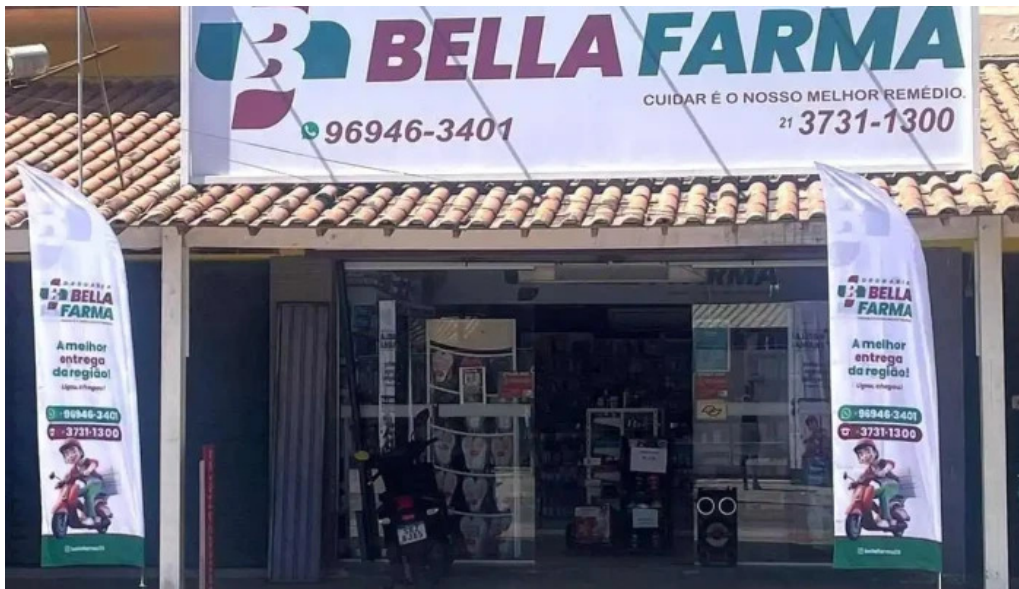
Drogaria bellafarma itapeba tudo