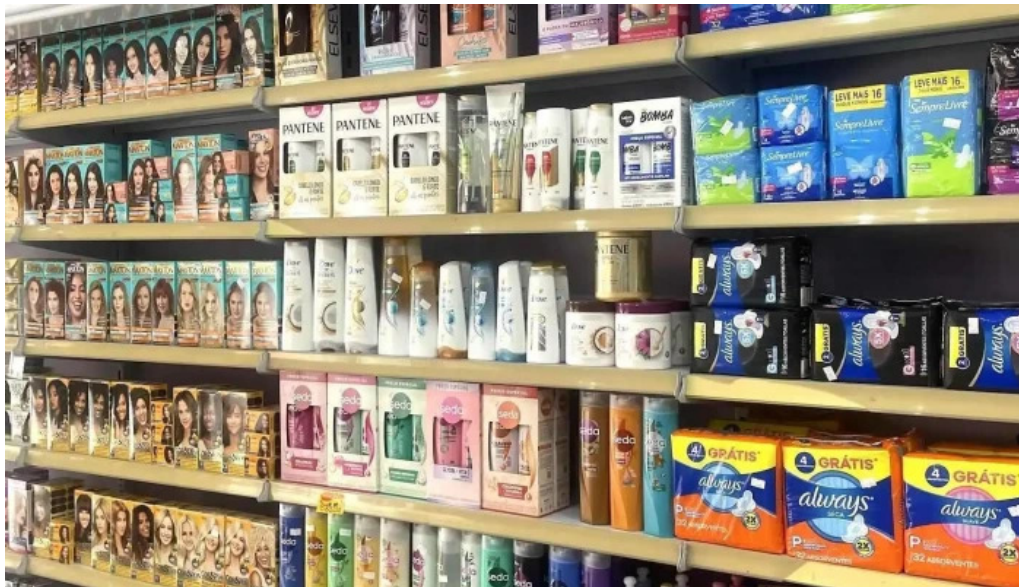
Drogaria bellafarma itapeba mais recentes