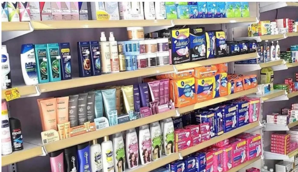
Drogaria bellafarma itapeba do proprietario