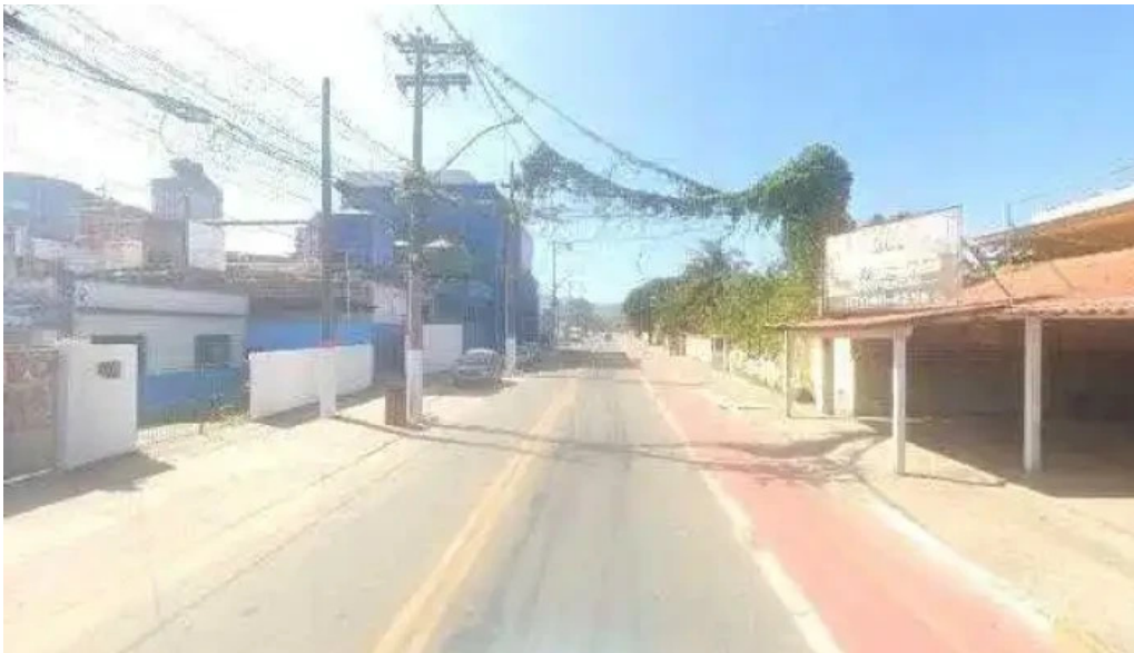
Drogaria bellafarma itapeba street view e 360deg