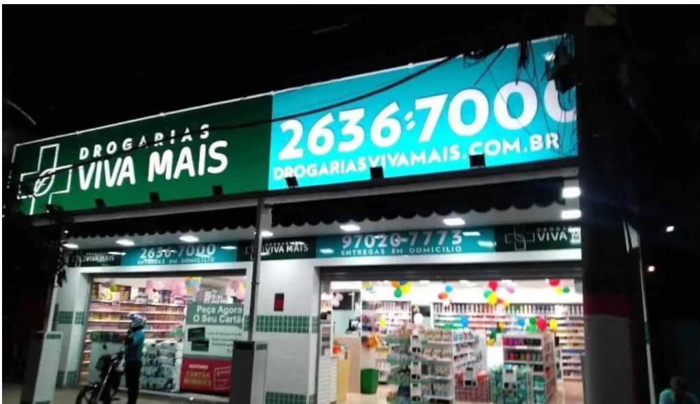
Drogaria viva mais inoa marica