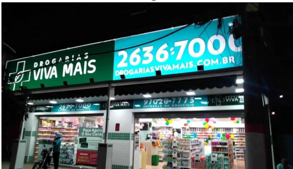
Drogaria viva mais inoa tudo