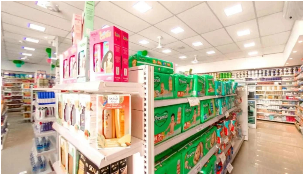
Drogaria viva mais inoa street view e 360deg