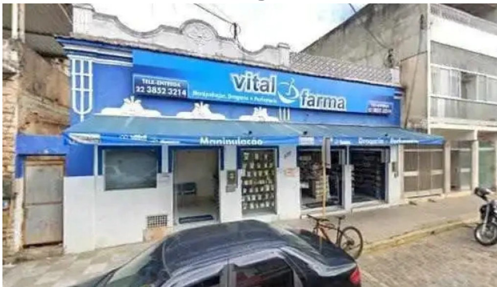
G r a farmacia de manipulacao tudo