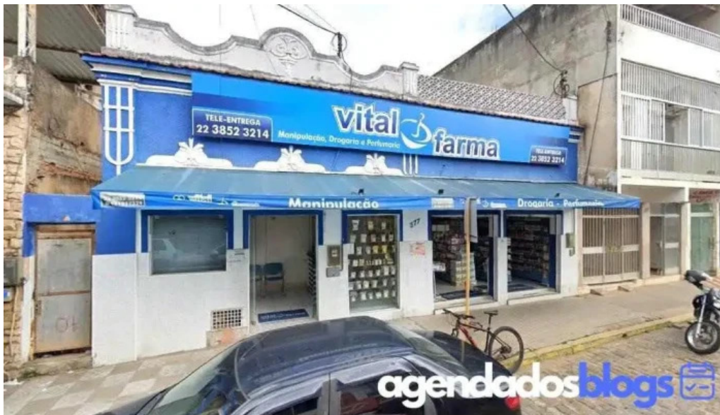
G r a farmacia de manipulacao miracema