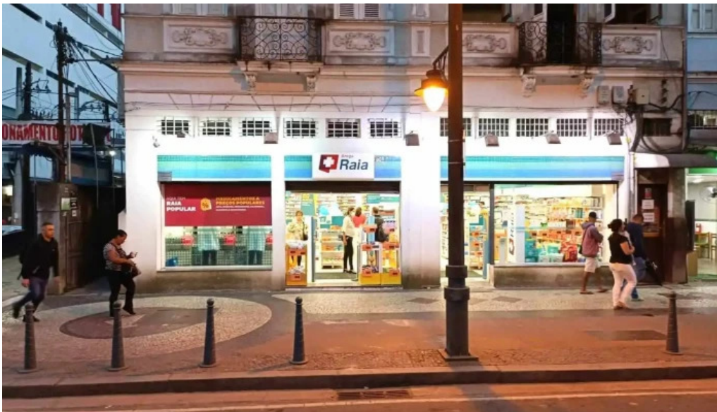
Droga raia tudo