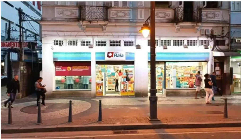
Droga raia petropolis