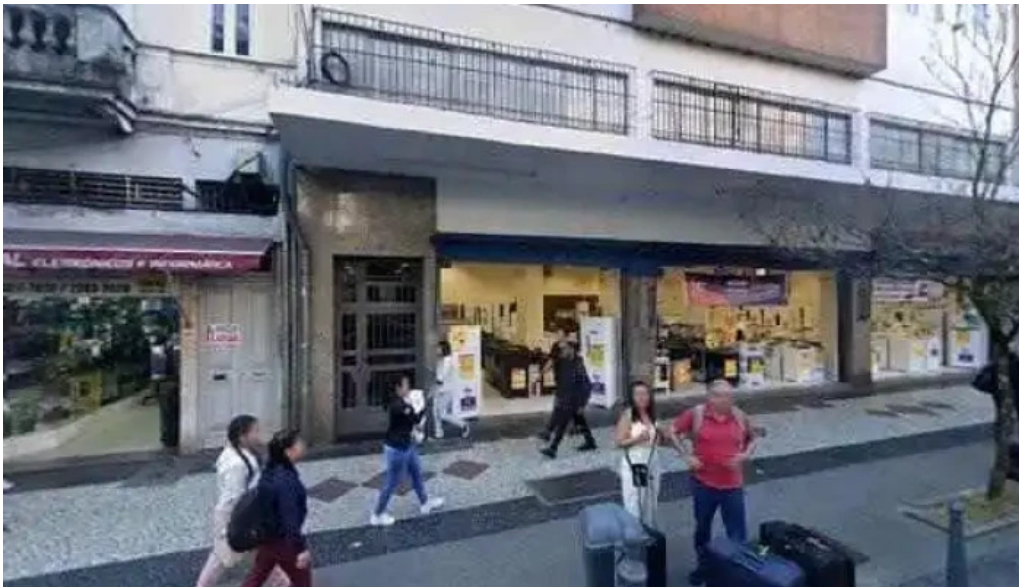
Droga raia street view e 360deg